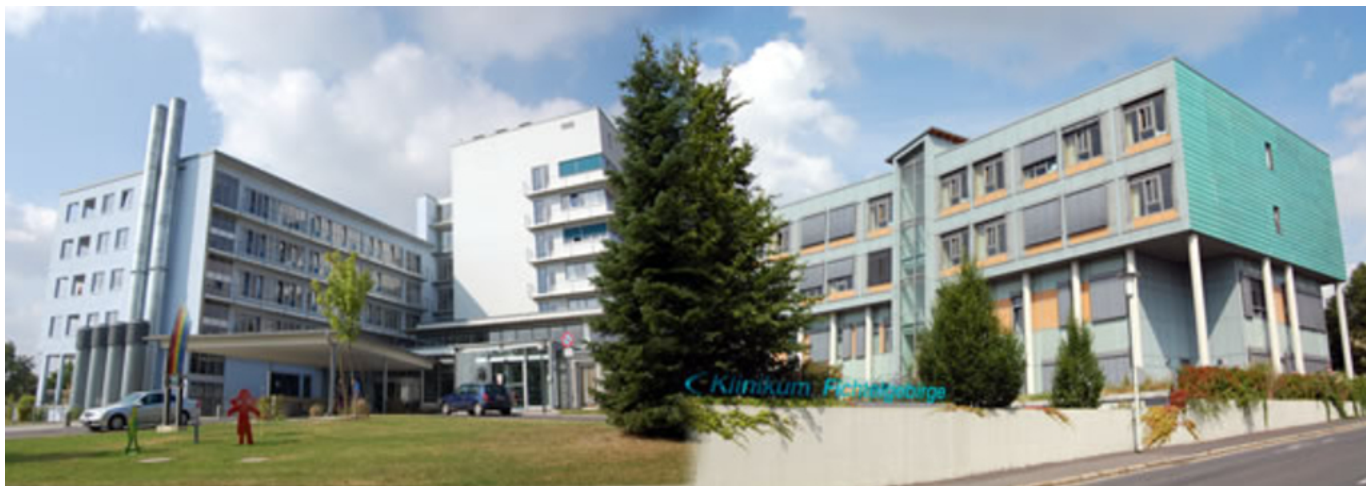
Abbildung: Klinikum Fichtelgebirge